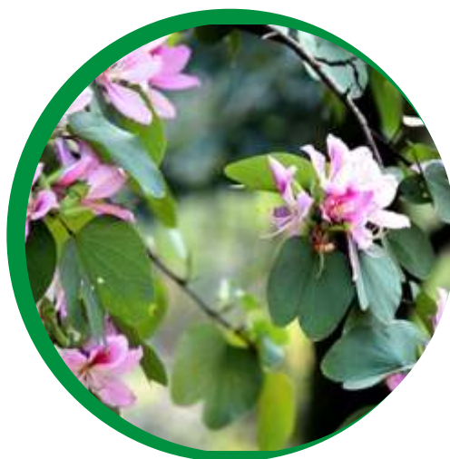
Folhas e flor