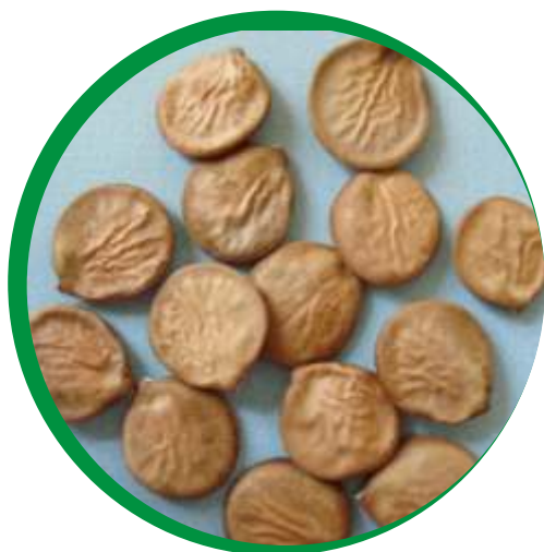
Fruto e sementes